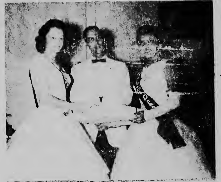
Foto reportage di celebracion di Carnaval 1959 durante weekend